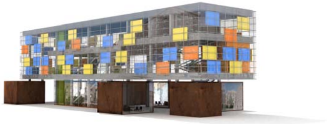
Romski kulturni centar